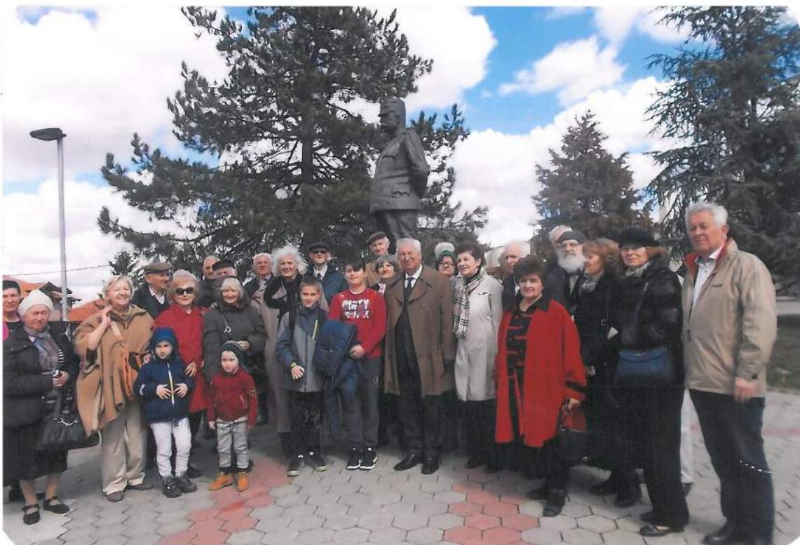
Потомци славних предака испред споменика Војводе Степе Степановића, председника Народне одбране од 1919. до 1929.године, на Дан његовог рођења,

Посета и обилазак значајних историјских места и објеката у Републици Српској (по посебном програму).