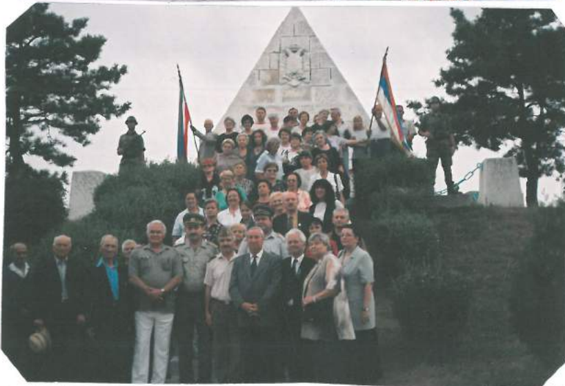
Чланови Савеза после полагања цвећа на Спомен-костурници у Међидији у Румунији