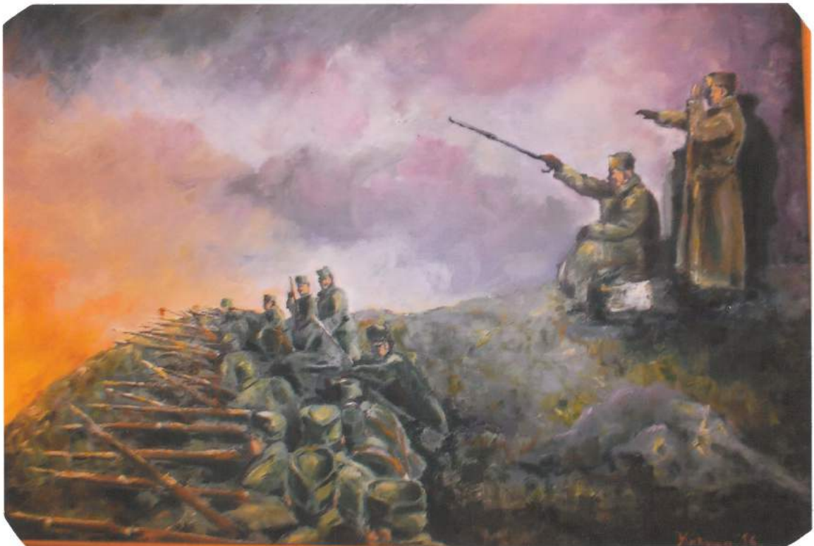
Краљ Петар Први Карађорђевић на положају своје Војске у Колубарској бици 1914.године

Обележавање годишњице оснивања Правитељствујушег Совјета (Прве српске Владе) у Великом Борку 1805. године (по посебном програму).