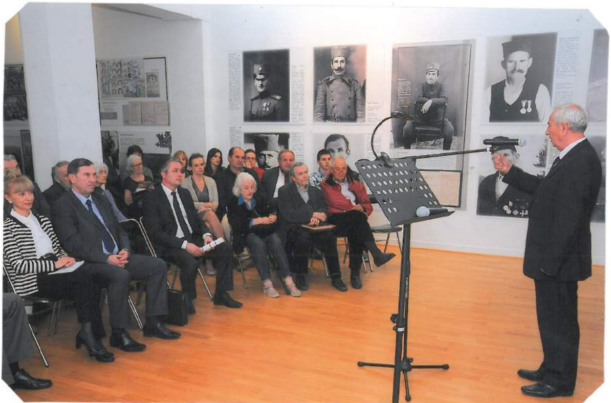
Са отварања изложбе Савеза «Албум сећања на наше предке у Првом светском рату», 22. октобра 2016. године у Српском културном центру у Паризу