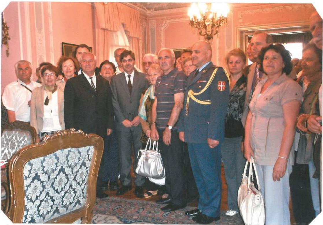
Са пријема у нашој Амбасади у Будимпешти, маја 2012. године

У циљу обележавања историјских догађаја, комеморација посете и обиласка значајних места и објеката, Републички одбор у сарадњи са нашим амбасадама, организује путовање кроз Централну Европу правцем: Београд- Сегедин- Будимпешта-СентАндреја-Вац-Нађмеђер-Братислава-Праг-Јендриковице-Герезин-Дрезден-Берлин-Потсдан-Оснабрик-Амстердан-Хаг-Ротердам-Брисел-Франфурт на Мајни-Улм-Грац-Загреб-Београд (по посебном програму).