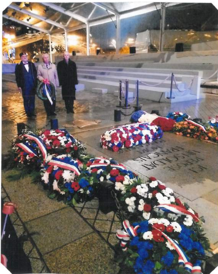
Делегација Савеза на полагању венаца на Гроб Незнаног Јунака под Тријумфалном капијом у Паризу, 11.11.2018.године, на 100.годишњицу историјског догађаја