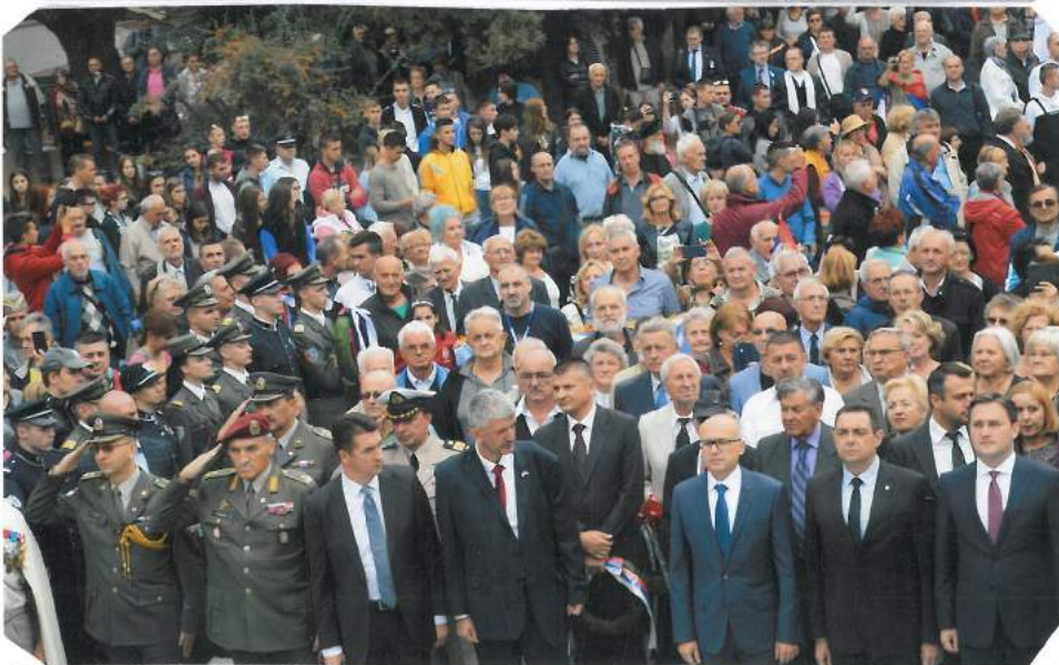
Чланови Савеза са угледним личностима на Зејтинлику у Грчкој 2018. године