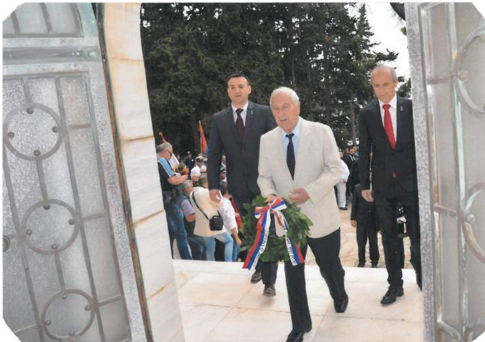
Са једне од комеморација пред Маузолејом славних предака на острву Видо – „Острву смрти“ - на Крфу

31. На искуствима и поукама из досадашњег рада у 2019. години, кроз облике свог деловања, Савез удружења потомака ратника Србије од 1912-1920. године има за циљ: бити и остати у служби свога народа и бити на висини части и поноса своје Отаџбине, под заставама које су овенчане славом наших славних предака. ЈЕР ЈЕ ОТАЏБИНА ИЗНАД СВЕГА!