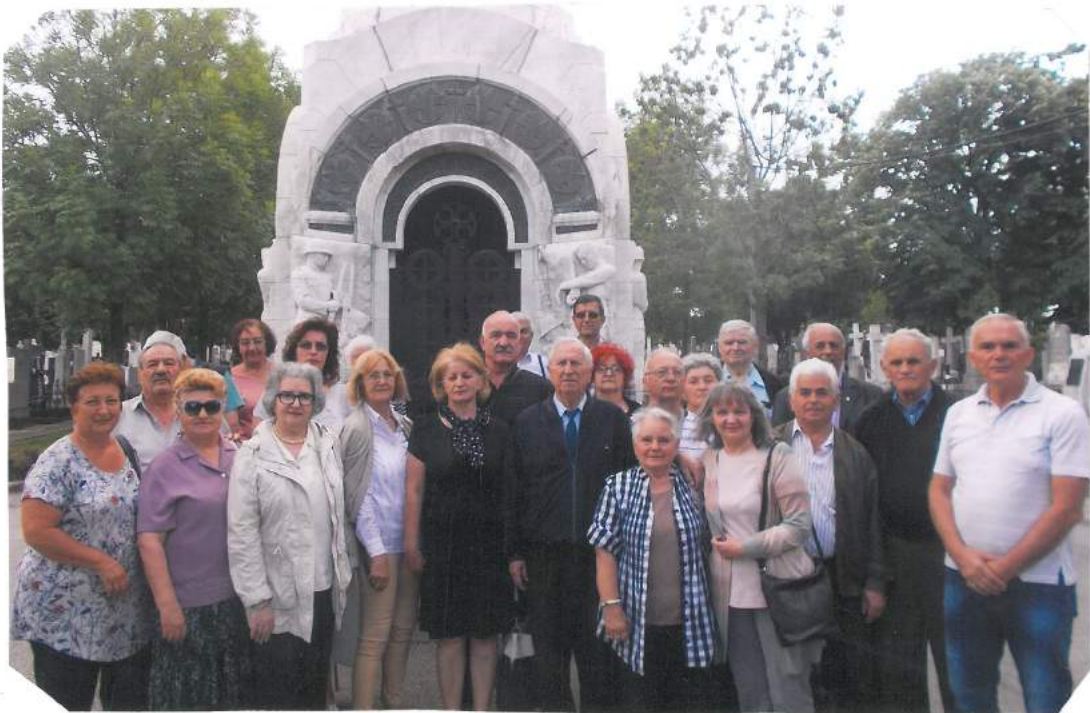
Чланови Савеза испред маузолеја Војводе Радомира Путника У Београду на обележавању Дана смрти славног Војводе 17.маја

Обележавање 102. годишњице Топличког устанка у Лепосавићу (за све организације и одборе Савеза на Косову и Метохији).