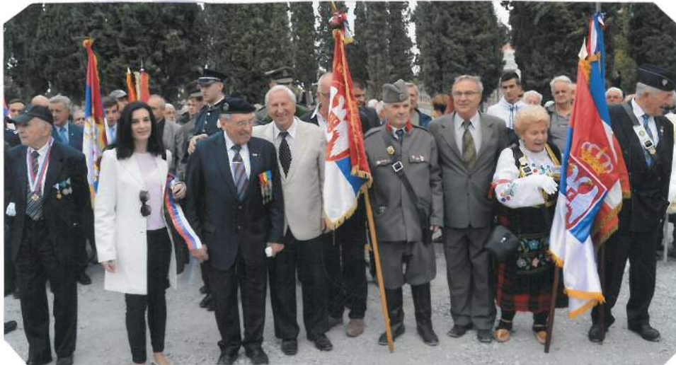
Са обележавања 100. годишњице пробоја Солунског фронта 1918. на Зејтинлику у Солуну 2018. години

Поводом обележавања 101. годишњице Солунског фронта 1918., а у циљу одавања поште и изражавања захвалности славним прецима, традиционално и ове године Републички одбор Савеза организује комеморације, посете и обилазак значајних историјских места на правцу: Београд-Ниш-Врање-Битољ-Атина-Коринт-Делфи-Микена-Термопили-Пелопонез (Спарта-МаратонскоПоље-Паралија-Олимп-Солун-Поликастрон-Дојран-Удово-Скопље-Београд (по посебном програму).