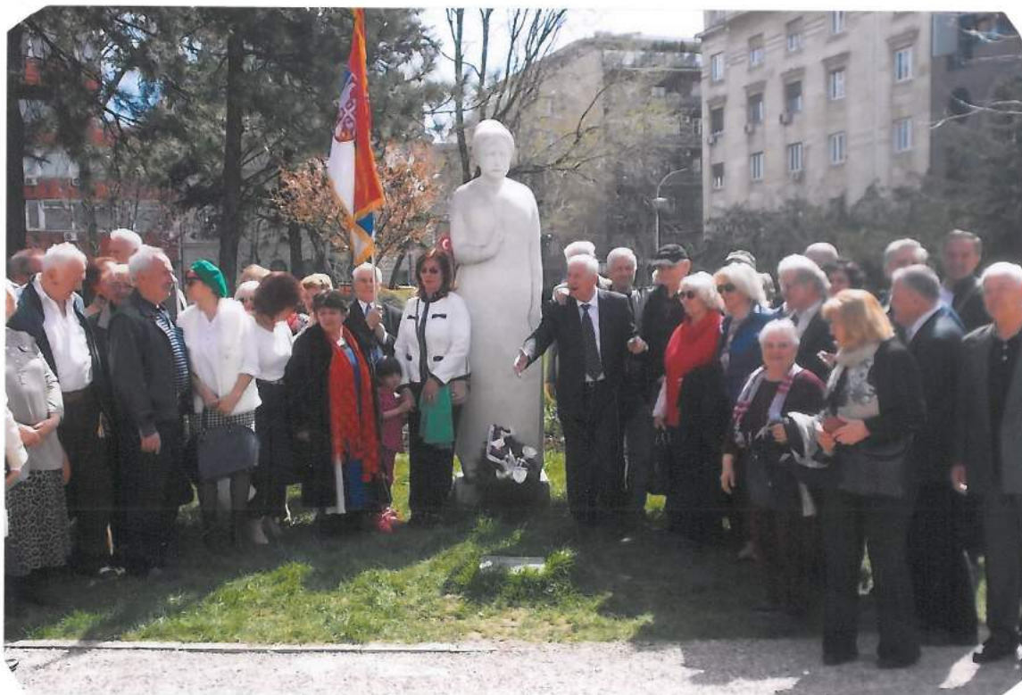
Чланови Савеза око споменика славне херојине Надежде Петровић, у Београду на обележавању Дана смрти, 3. априла 1915.

Обележавање Дана смрти Војводе Степе Степановића (по посебном програму).